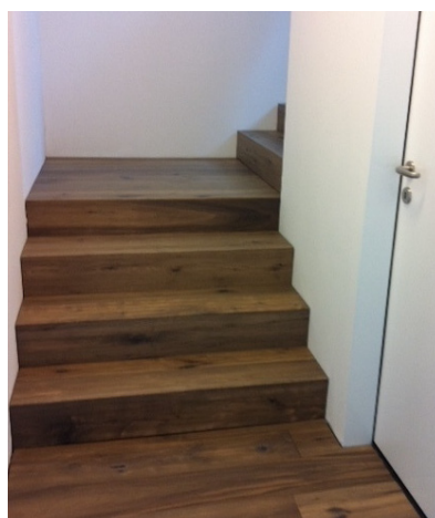
Im Treppenhaus wurde ebenfalls der Eichenboden eingesetzt.