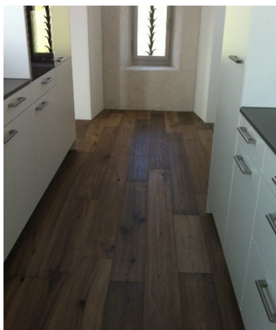
Der Eichenboden passt mit seinen warmen Farbtönen gut in die Küche des Schlosses.